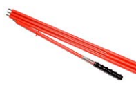
Sonda di prova allungabile fino a 2 m (terminale banana) nero